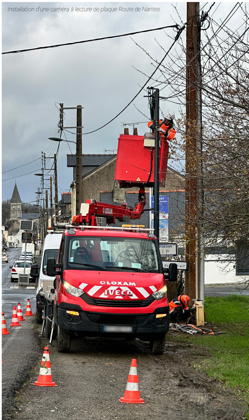
Installation d'une caméra à lecture de plaque Route de Nantes

Il s'agit d'antennes directionnelles qui permettent d'établir des liaisons entre les caméras et le système d'enregistrement. Elles ont une puissance de 1W, ce qui équivaut à la puissance d'un téléphone portable et sont installées a minima à 5 mètres du sol, soit hors de portée des personnes. Il faudrait se trouver pendant une très longue durée sur l'axe de transmission pour en ressentir des effets.