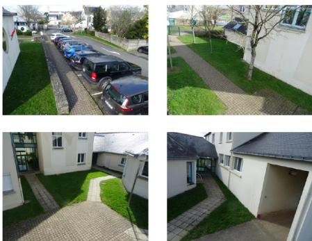
Vue théorique des caméras contextuelles du groupe scolaire La Pierre Bleue