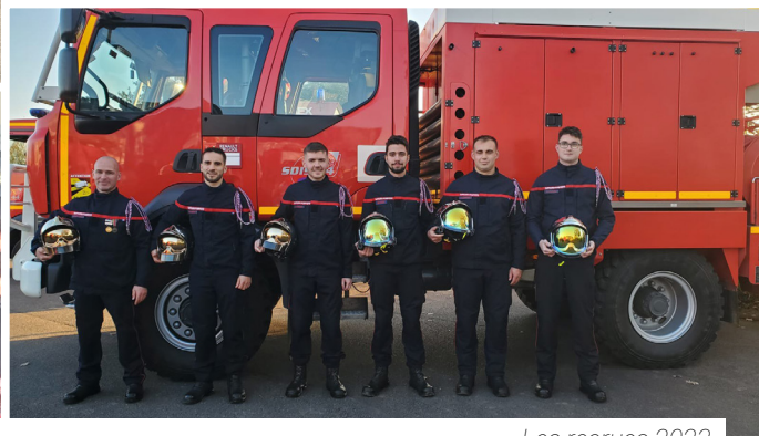
Les recrues 2023