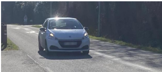
Vue théorique de la caméra à lecture de plaques située Route de Nort sur Erdre