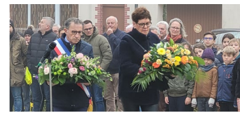
Cérémonie du 11 novembre 2022