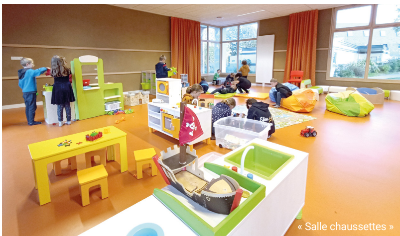
« Salle chaussettes »

J'aime tout : la maison, les legos et les jeux dans la salle des grands Mathis, 5 ans