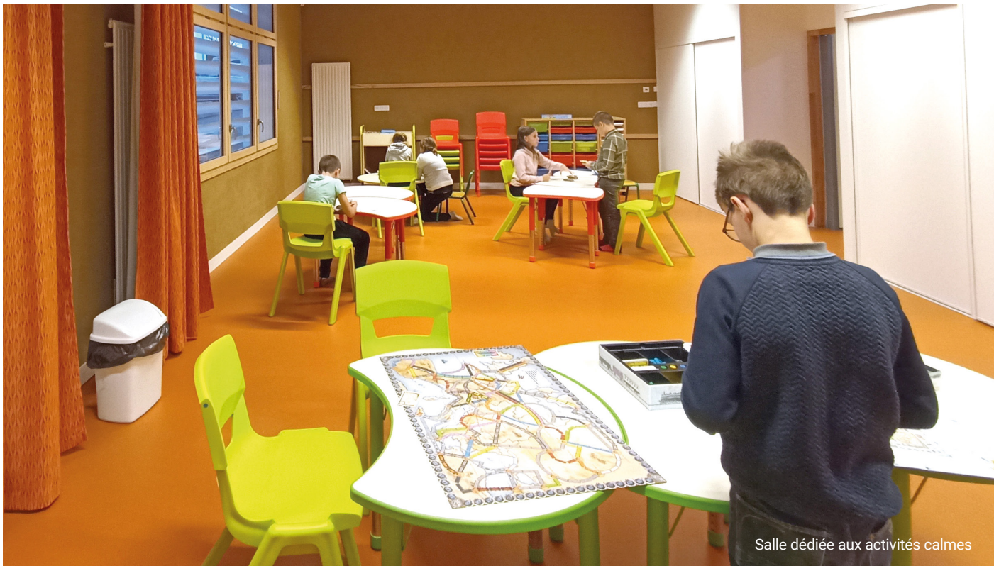
Salle dédiée aux activités calmes